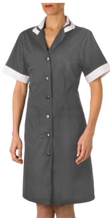
119 Grigio medio